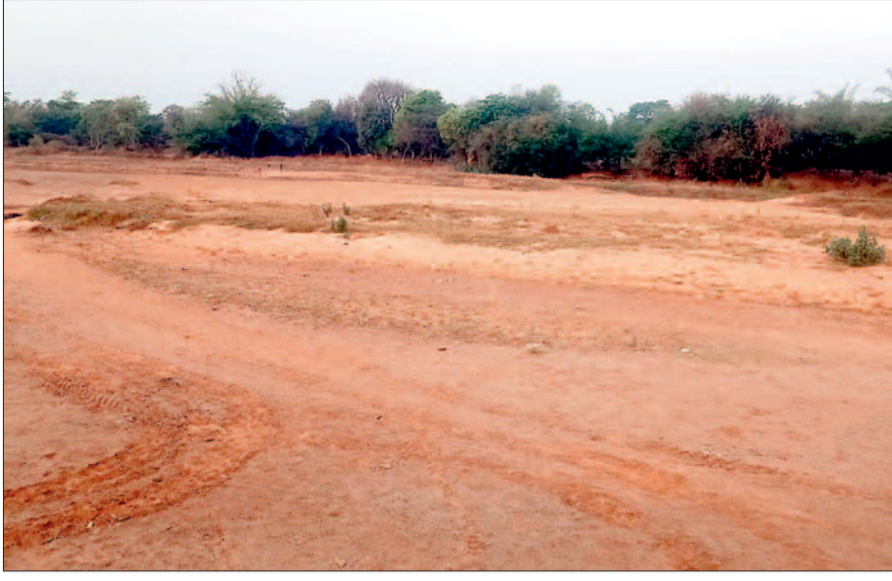
पानी की एक-एक बूंद के लिए आने वाले दिनों में करना पड़ सकता है संघर्ष