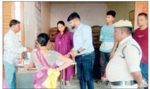
में खाद्यान्न वितरण की स्थिति, अन्व अभिलेखों की जांच की गई। स्टॉक पंजी, वितरण रजिस्टर सहित अधिकारियों ने विक्रेताओं को